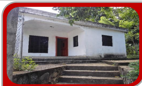
C-15717 ZONA NORTE

Vivienda de un nivel, 350 mts2 de terreno y 115mts const., 3H, 1B, sala, comedor, cocina, galería y terraza. Ubicada en la Calle Penetración (al lado del río Yami), Bayacanes, La Vega. ..