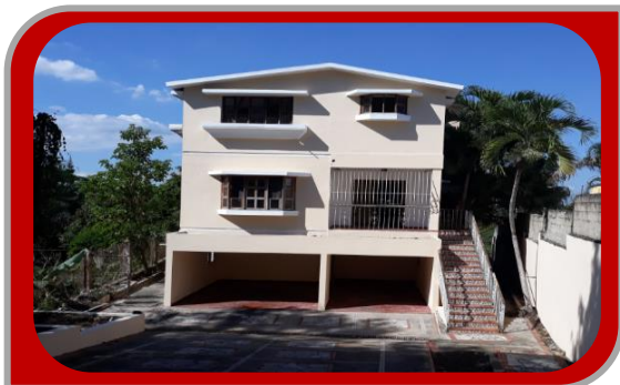
C-21618 DISTRITO NACIONAL

Vivienda 3N 644.82 Mts2 de terreno. y 350.00 de const., 5H, 7B, sala, comedor, estar familiar (varios), terraza, gazebo, 2 Cocina, 5 parqueos, balcón. Ubicada en la C/Carmen Natalia Bonilla No. 3 (Cul de Sac), Cuesta Brava, Distrito Nacional.